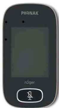
Roger Touchscreen Mic